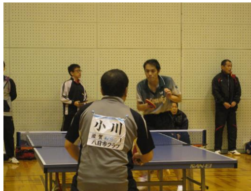
福西監督試合風景