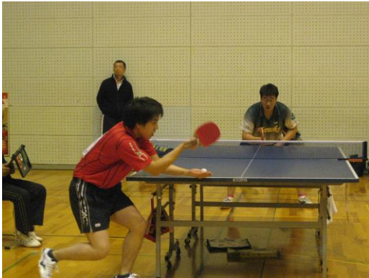
黒田選手試合風景