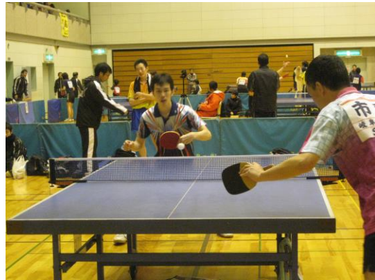
真鍋選手試合風景