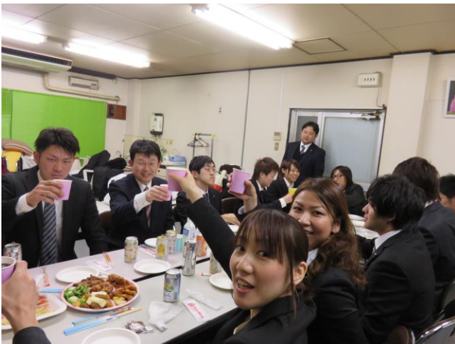
(辞令交付式後の慰労会写真)