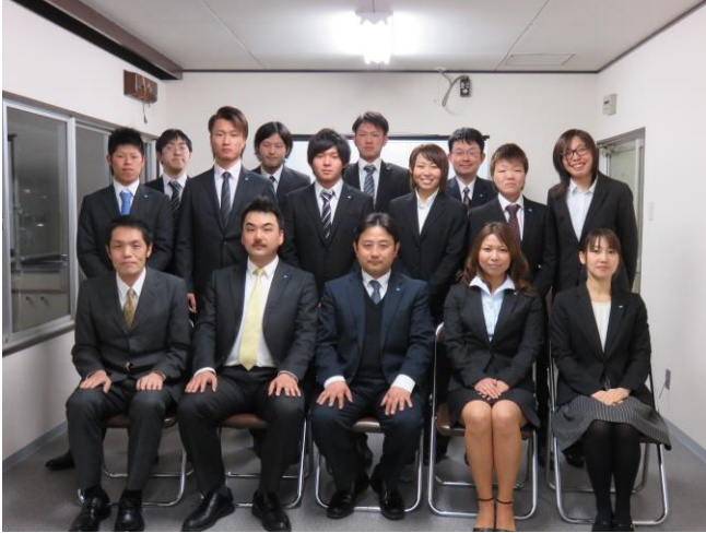
(2015年3月4日 第一回辞令交付式集合写真)