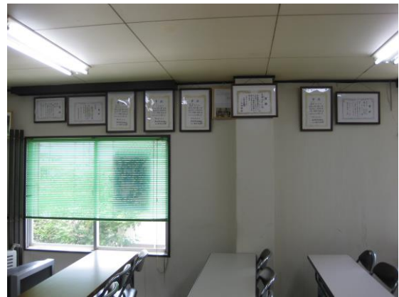
※株式会社ヒューマンドリーム研修室（2F）