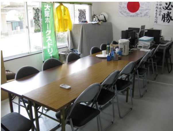
株式会社ヒューマンドリーム情報処理室兼ミーティングルーム（2F） パソコン3台 インターネット使用可能