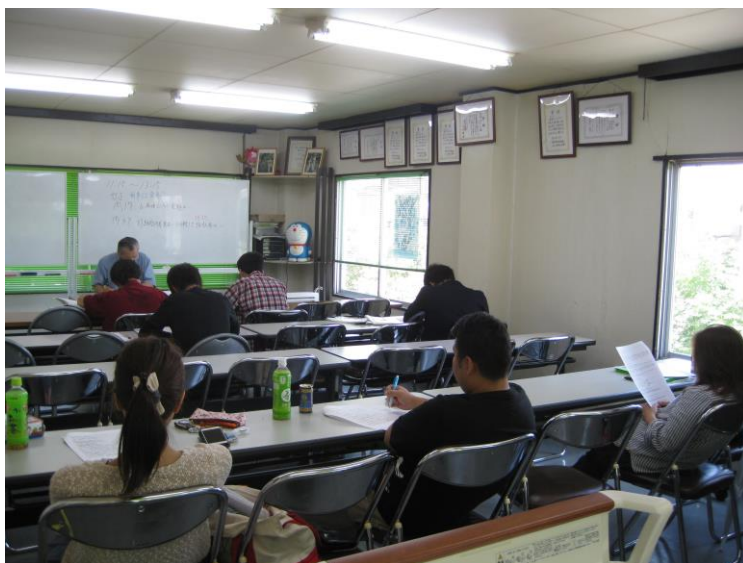
(塾生講義受講風景)