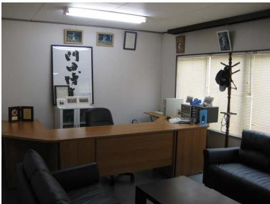
※株式会社ヒューマンドリーム経営戦略室兼応接室（2F）