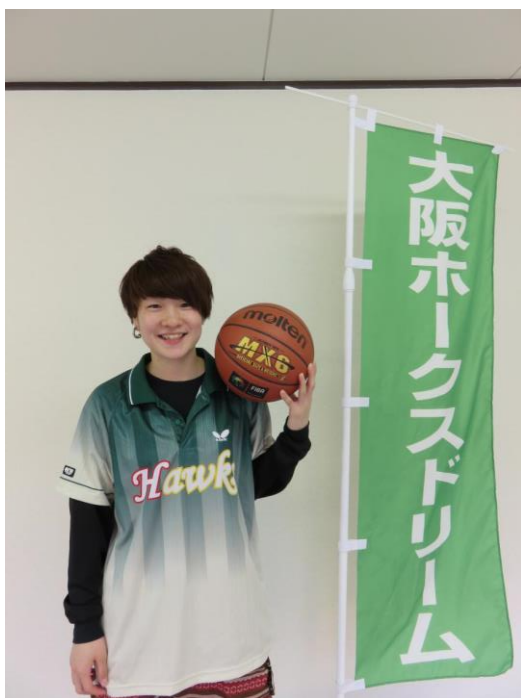
私立四天王寺羽曳丘高校－芦屋大学出身