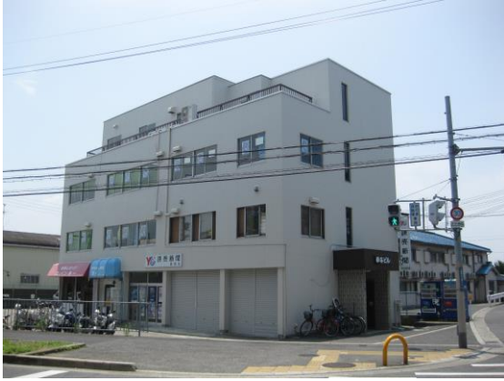
※株式会社ヒューマンドリーム本社外観