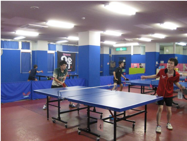
(男子卓球部練習風景②)