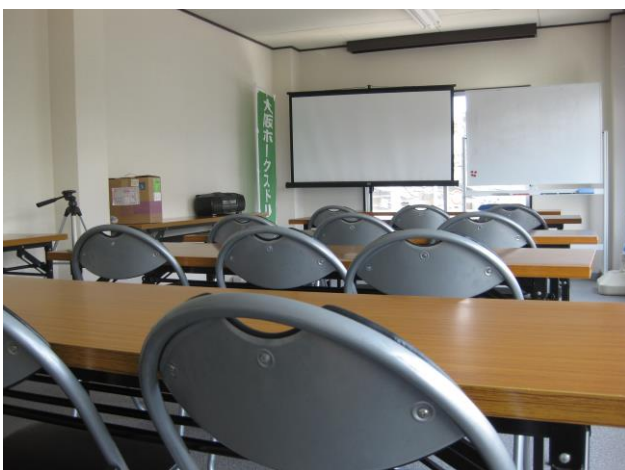
株式会社ヒューマンドリーム会議室（3F） プロジェクター使用可能 プレゼンテーション仕様