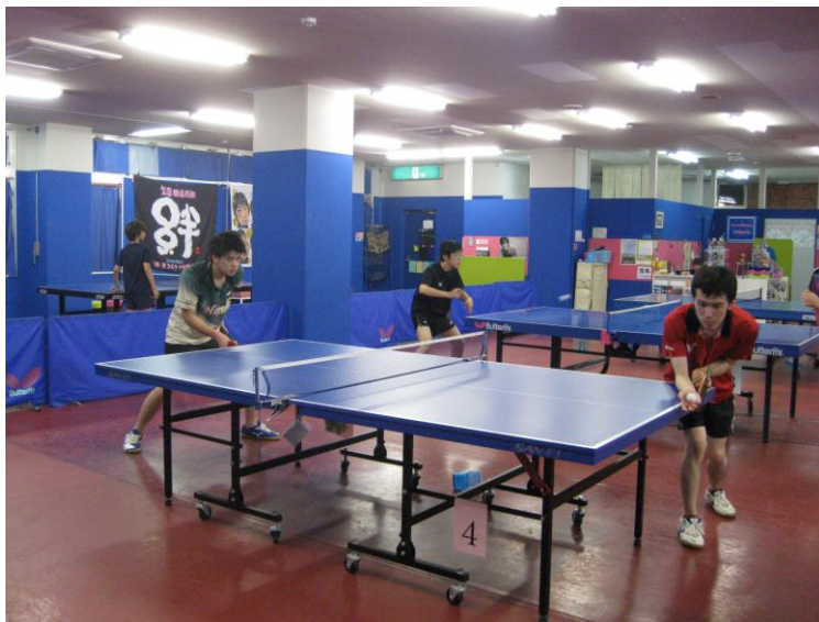
(男子卓球部練習風景①)

2015 年 6 月 14 日 第 93 回高石市市民オープン卓球大会 男子シングルスシニア優勝