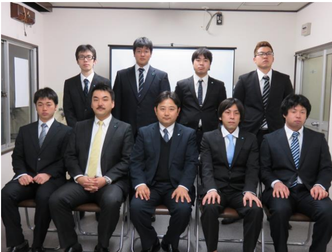
(2015年3月11日 第二回辞令交付式集合写真)